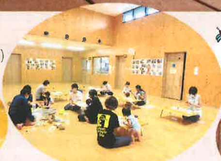
敬老の日のプレゼントづくり(9/7)