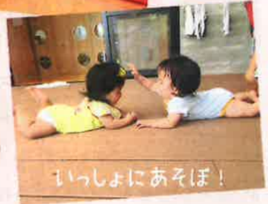
いっしょにあそぼ!

たんぽぽ広場は、主に家庭で子育てをしているお母さん達が集まり、情報交換したり、お子さんと一緒にみんなで楽しく遊べる交流の場です。お父さん、おじいちゃん、おばあちゃん、もうすぐママになる方もお気軽にご利用ください!!