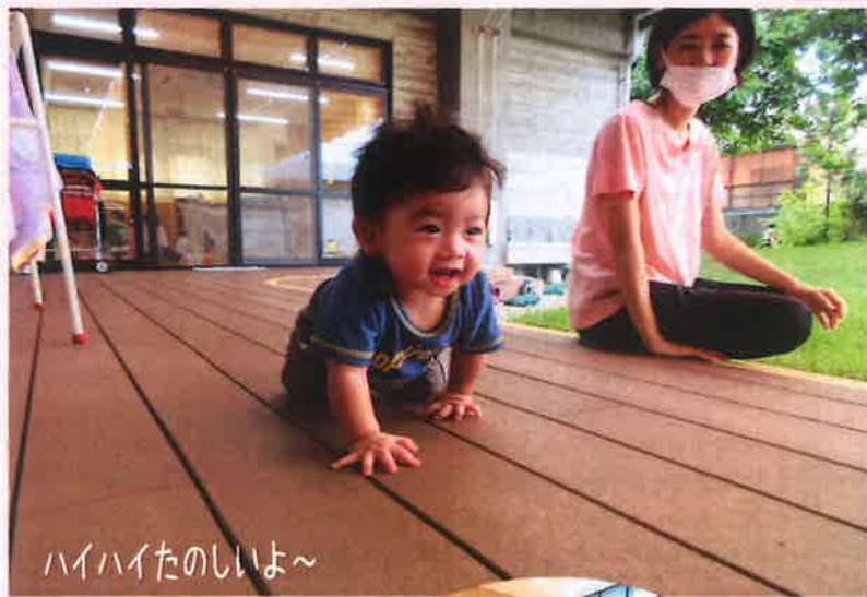
ハイハイたのしいよ~

子育て支援センターたんぽぽ広場は、 国・市が補助金を出し、つくられています。 ですから無料で利用できます。 (尚、特別行事等、材料費がかかる場合はその都度 お知らせしています。) 詳しくは支援センターまでお問い合わせ下さい。