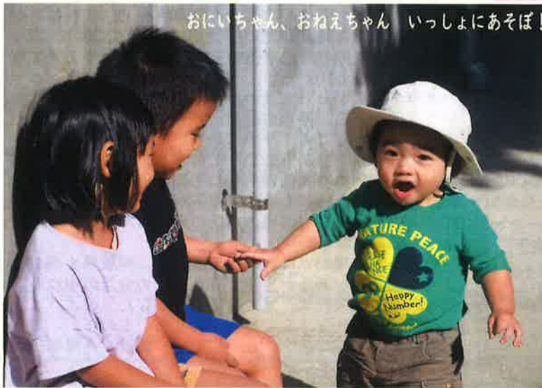
おにいちゃん、おねえちゃん いっしょにあそぼ!

子育て支援センターたんぽぽ広場は、 国・市が補助金を出し、つくられています。 ですから無料で利用できます。 (尚、特別行事等、材料費がかかる場合はその都度 お知らせしています。) 詳しくは支援センターまでお問い合わせ下さい。