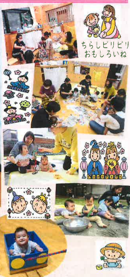
ちらしビリビリ おもしろいね