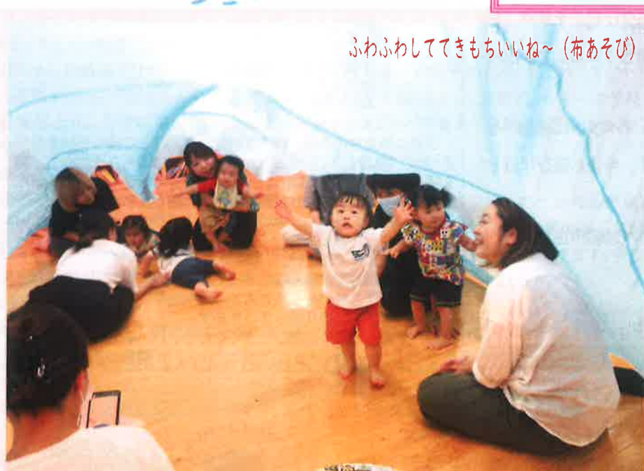
ふわふわしてきもちいいね~ (布あそび)

子育て支援センターたんぽぽ広場は、 国・市が補助金を出し、つくられています。 ですから無料で利用できます。 (尚、特別行事等、材料費がかかる場合はその都度 お知らせしています。) 詳しくは支援センターまでお問い合わせ下さい。