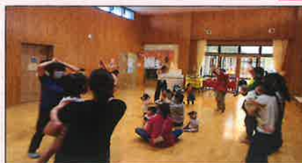
お母さん励ます会 ~3/25