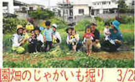
園畑のじゃがいも掘り 3/28