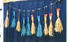
素敵なこいのぼりがたくさんできました

たんぽぽ広場は、主に家庭で子育てをしているお母さん達が集まり、情報交換したり、お子さんと一緒にみんなで楽しく遊べる交流の場です。お父さん、おじいちゃん、おばあちゃん、もうすぐママになる方もお気軽にご利用ください!!