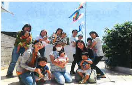
こいのぼりとパチリ!

子育て支援センターたんぽぽ 広場は、国・市が補助金を出 し、つくられています。 ですから無料で利用できます。