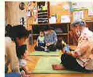
たんぽぽあちゃんと