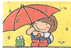
あめぼったん ひろかわさえこ

あめあめ ぼったん あめ ぼったん。 はっぱのうえに あめ ぼったん。はっぱのかげから かたつむり。 雨の日は楽しいな！