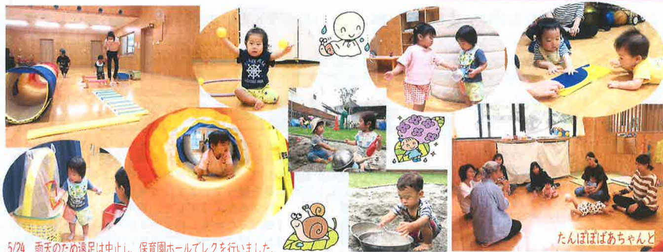
5/24 雨天のため遠足は中止し、保育園ホールでレクを行いました。

子育て支援センターたんぽぽ 広場は、国・市が補助金を出 し、つくられています。 ですから無料で利用できます。