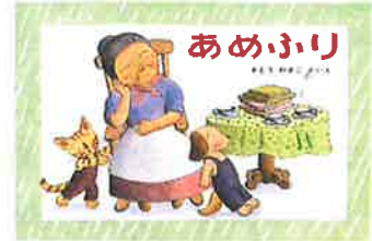
絵本あらすじ：絵本ナビ

ばばあちゃんのシリーズの第3作。毎日毎日雨ばかり降り続くので、怒ったばばあちゃんは雲の上の雷に向かって大声で言った。 「ようし、こっちにも考えがあるよ」