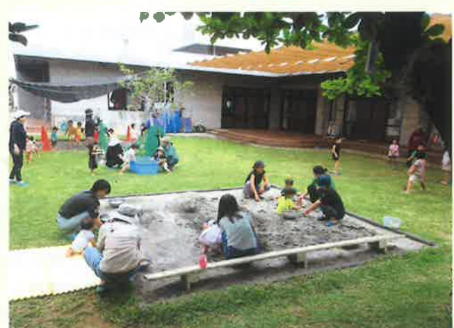
園庭で砂遊び 園児も一緒に遊んでいます

利用料は無料！ 子育て支援センターたんぽぽ広場は、国・市が補助金を出し、つくられています。ですから 無料 で利用できます。