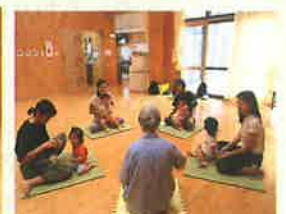
雨の日はホールで過ごします たんぽぽばあちゃん

たんぽぽ広場は、主に家庭で子育てをしているお母さん達が集まり、情報交換したり、お子さんと一緒にみんなで楽しく遊べる交流の場です。お父さん、おじいちゃん、おばあちゃん、もうすぐママになる方もお気軽にご利用ください！！