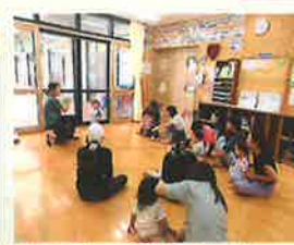
絵本の読み聞かせ (毎週月・金はお母さんの日) いつもありがとう！